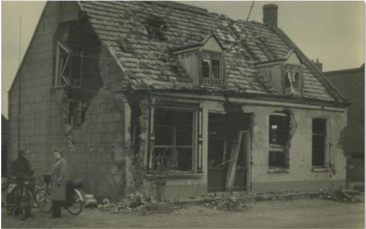
afbeelding 4 Oorlogsschade in Hoogerheide, Bron: BeeldbankWO2.nl, beeldnr: 124582