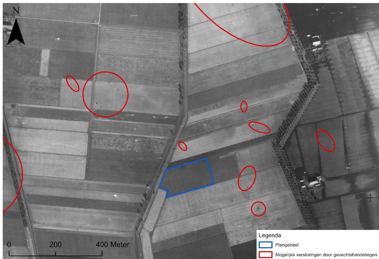
afbeelding 3 Luchtfoto van 12 oktober 1944 waarop verschillende (mogelijk) verstoringen door oorlogshandelingen zichtbaar zijn.